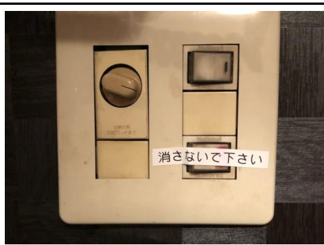
換気扇のスイッチ 切らないでください