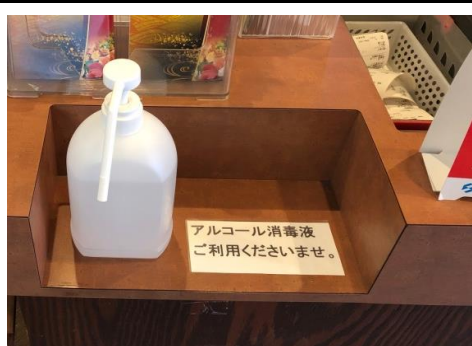
入店時にアルコール消毒 お願いしております