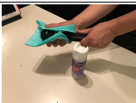
マイクは毎回1本1本 丁寧に消毒しています