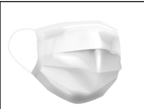
従業員はマスクを していることがあります