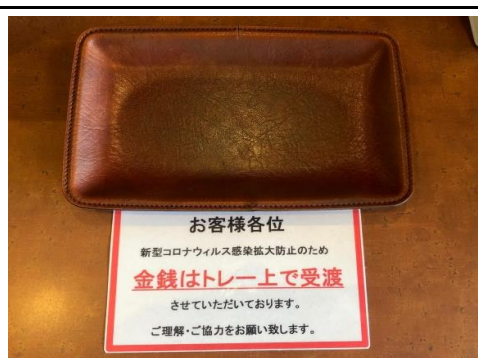
金銭等のやり取り トレー上で実施しています