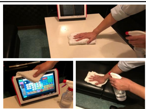
清掃・除菌を 徹底しています