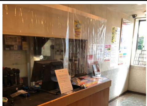
フロントに飛沫防止シート 設置しています